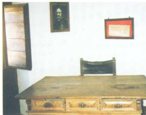
Mesa donde Quevedo escribió sus últimos versos, en la Celda que se conserva en la Hospedería Real El Buscón de Quevedo.

En lo que a los vinos se refiere, sobresalen los de la Denominación de Origen "LA MANCHA", como las marcas: Hidalguía de Villanueva, San Fernando, Señorío de Quevedo, Señorío de Guadianeja, Torre de Gazate, Protillejo, Añil, Estola y Yuntero.