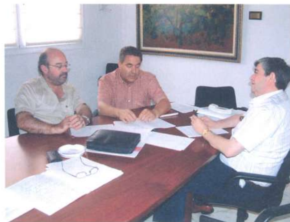
Reunión con miembros de UCLM.

Tras la reunión, se consideró oportuno la creación de un Grupo de Trabajo, cuyos primeros esfuerzos se centrarán en el análisis de viñedos, variedades, climatología, tipos de suelos, características analíticas de los vinos, etc., ya que todo ello debe ser previo al análisis de viabilidad de cada posible "zona" o "subzona". Por su lado, el Consejo aportará al grupo los trabajos realizados al respecto y las propuestas de subzonas desarrolladas en otras épocas anteriores.