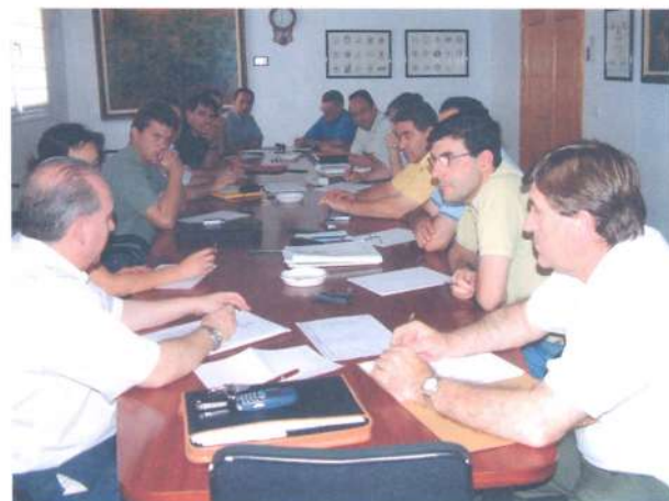
Reunión con técnicos de bodegas.

El argumento de la "zonificación" puede suponer un acicate y el definitivo lanzamiento de los vinos de la Zona de Producción "LA MANCHA".