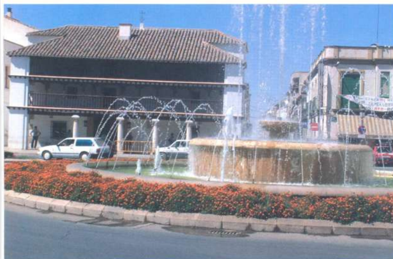
Fuente y Posada Los Portales

En Semana Santa, las procesiones de Pascua destacan por su sobriedad y espíritu participativo, con la intervención de 12 Cofradías y Hermandades. El acto más emblemático es la Procesión del Silencio , celebrada en la madrugada del Viernes al Sábado Santo.