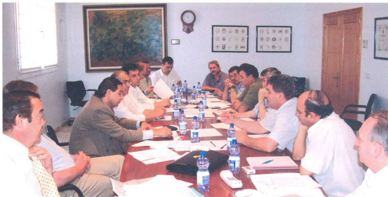
Reunión con Organizaciones Profesionales.

Los responsables del Consejo también trataron el