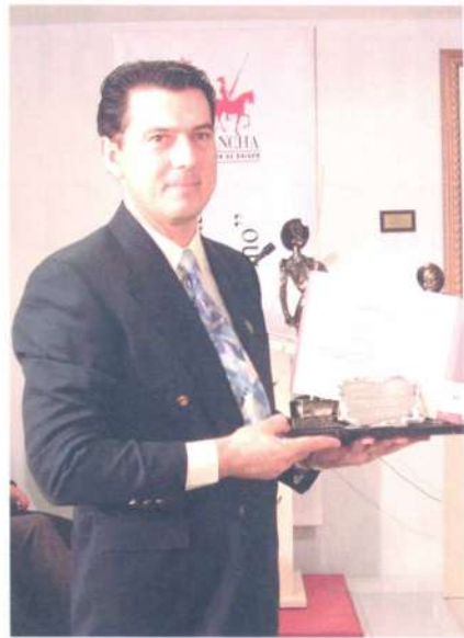
Premios al Gusto