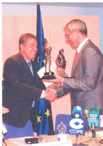
Premio Investigación del Vino