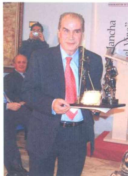
Premios a la Divulgación de la Cultura del Vino