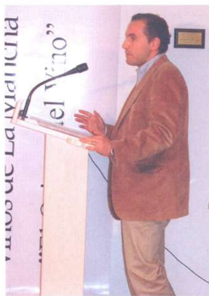
Premios Maestro del Vino