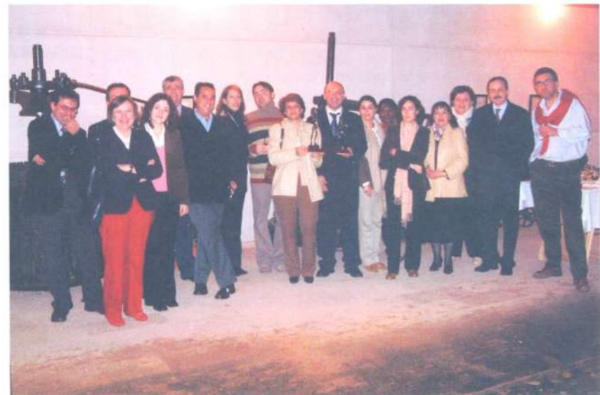
Grupo de Investigadores de la UCLM