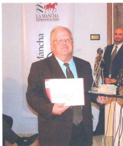
Premio Fidelidad al Vino