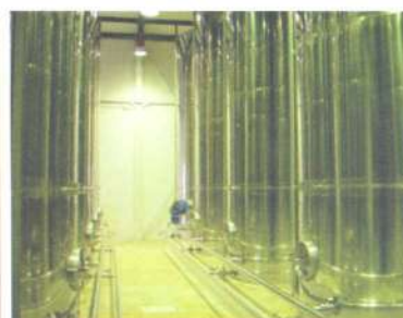
Depósitos para Aceite

Crta. Tomelloso, Km. 1,8 - 02600 VILLARROBLEDO (Albacete) Tlf: 902 141 533 Fax: 967 145 875 E-mail: comercial.parcitank@polalsa.com Web: www.polalsa.com