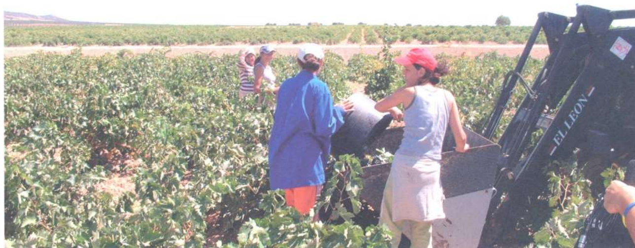
La vendimia manual sigue siendo la mayoritaria en la Zona de Producción

Aunque se trata de valoraciones globales que pueden variar según la zona de que se trate, lo que resulta evidente es que en todos los casos se trata de uvas con mucho color y, consecuentemente, los vinos obtenidos de ellas tendrán mucha capa.