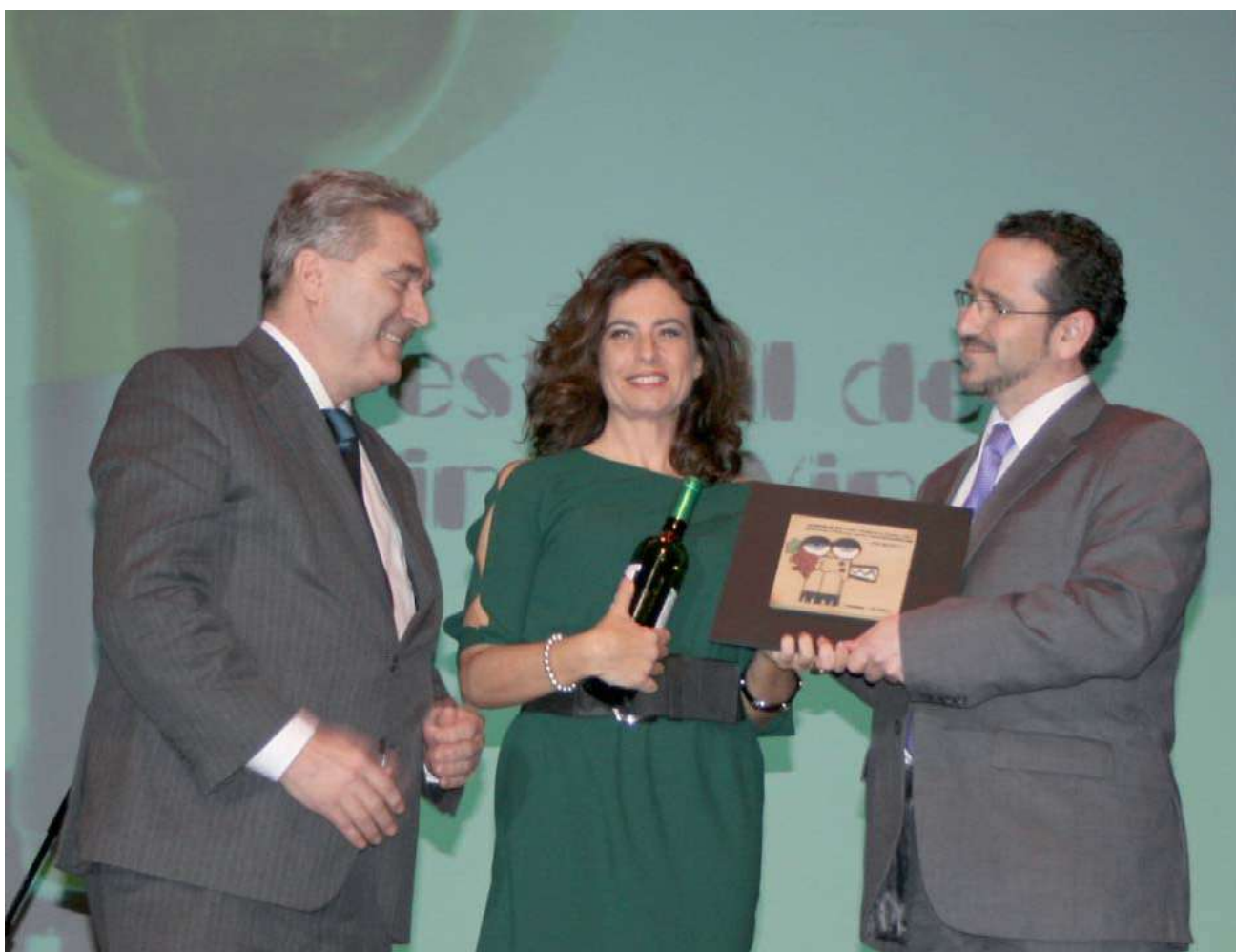
LA ACTRIZ HOMENAJEADA EN ESTA EDICIÓN FUE LA TOLEDANA LOLA BALDRICH