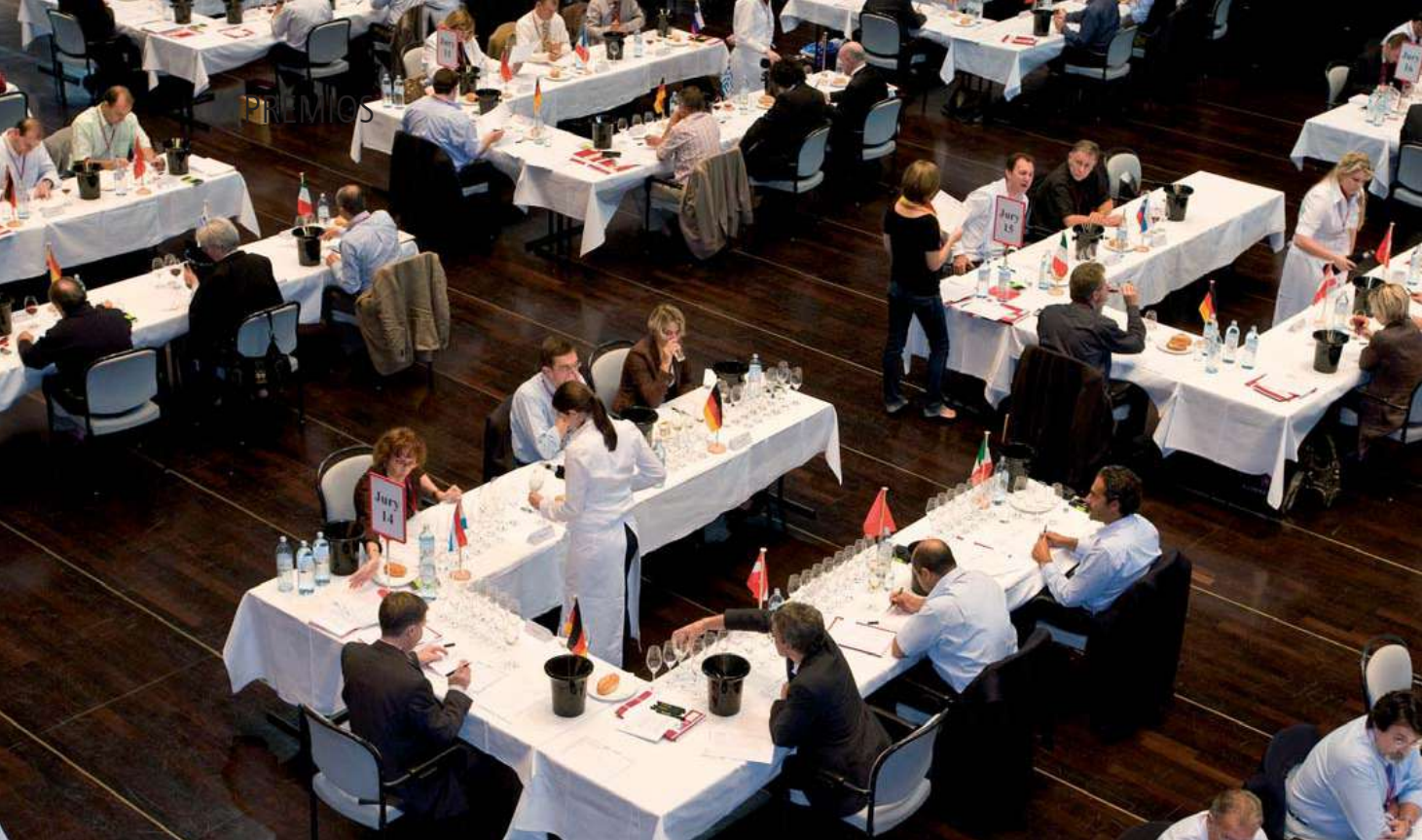
Alemania y China ensalzan la calidad de los vinos manchegos.