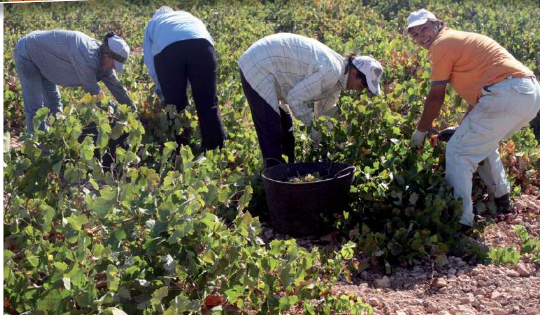
La vendimia manual y las plantaciones de viñedos en vaso siguen siendo las predominantes en La Mancha.