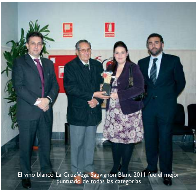
El vino blanco La Cruz Vega Sauvignon Blanc 2011 fue el mejor puntuado de todas las categorías