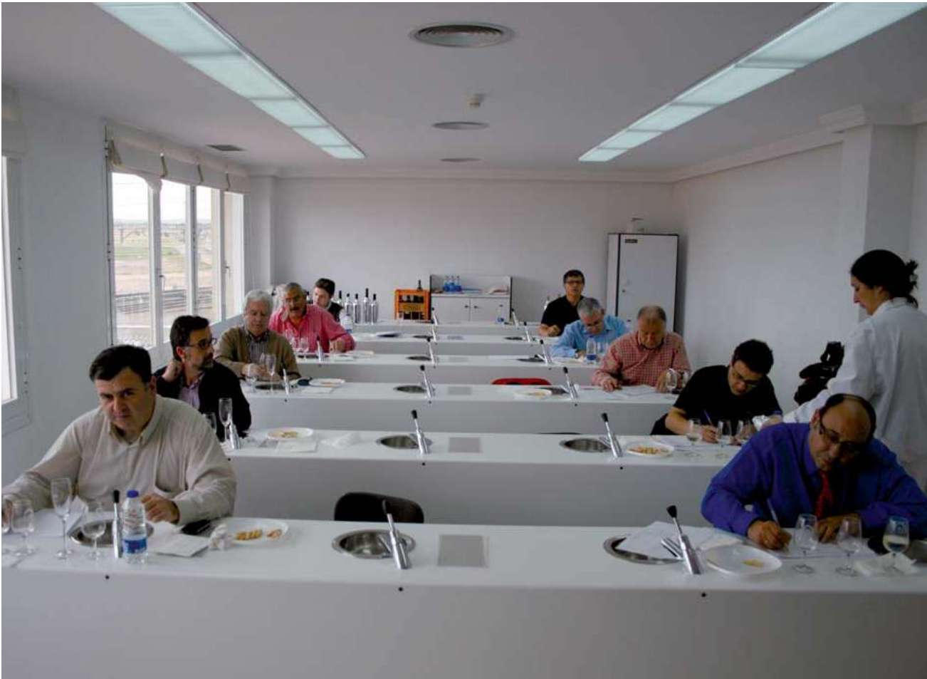
Para muchos bodegueros, la añada 2011 será recordada como una cosecha histórica.