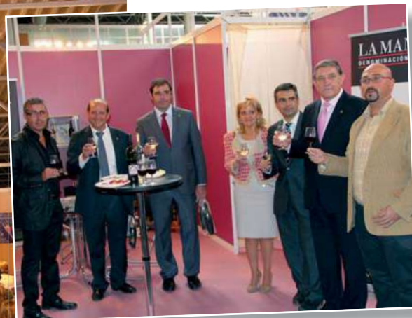
Más de 60 personas participaron en la cata temática de vinos manchegos, entre los que ya se incluían algunos de la añada 2011, aunque no totalmente acabados.