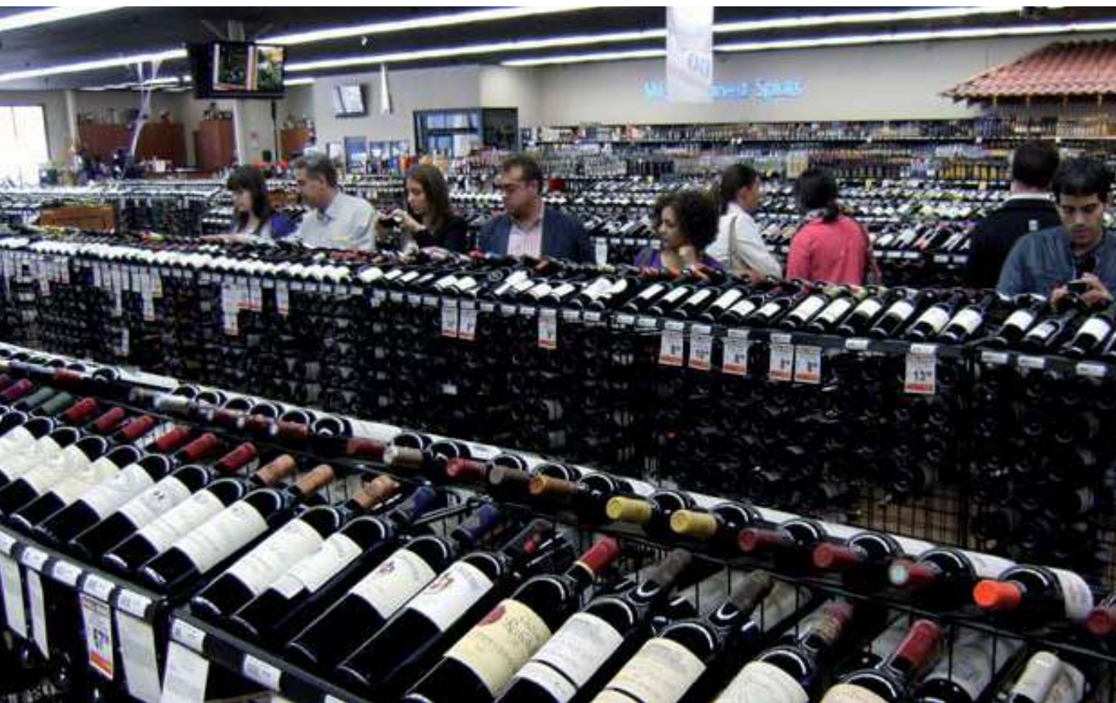
Superficie comercial tejana visitada por los bodegueros de la D.O. La Mancha.