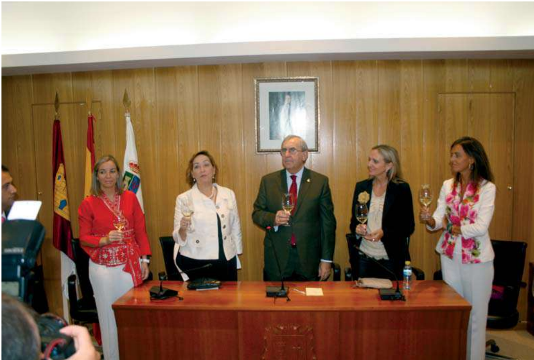
La consejera de Agricultura, pregonera de las Fiestas, brindó por el futuro del sector.