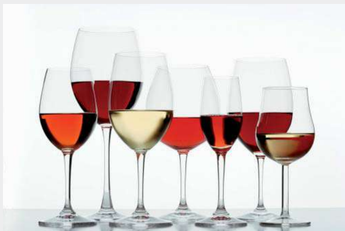
Diversidad de copas según el vino elegido

Continuando con otro tipo de copas, tenemos: