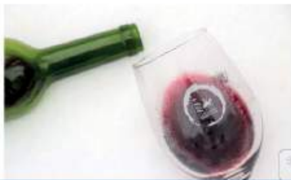
Mancha tu vida, instrucciones

Premio: El truco o trato que obtenga más votos ganará como premio el peso de su autor en litros de vino de la Mancha (si pesas 60 kilos,