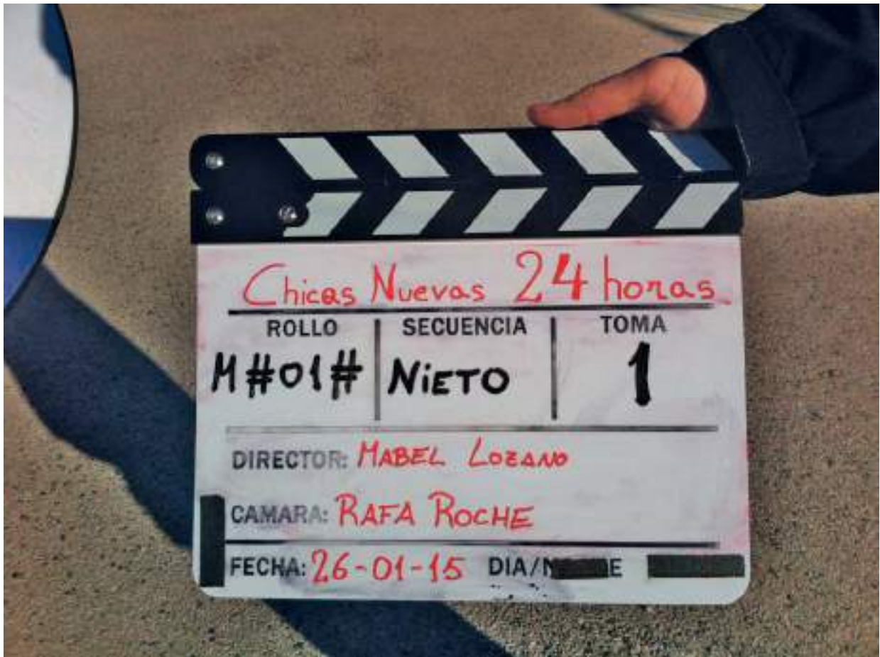
Rodaje de 'Chicas Nuevas 24 h'.

que puedo y tengo tiempo. Mi aperitivo siempre es un vino, y además es blanco, porque me gusta más y me parece perfecto como aperitivo; pero por la tarde me gusta más un tinto. A parte, nosotros no nos damos cuenta del lujo que es: hay países en los cuales o no hay o es muy caro. Nuestros vinos de La Mancha son magníficos, y eso es extraordinario, que cada región tenga sus vinos, lo cual aporta todo: sabores, olores, texturas... riqueza a todos los niveles, tanto gastronómico como cultural. Yo, lógicamente al ser 'manchega', intento utilizar los vinos de La Mancha, y es verdad que es absolutamente maravilloso ir a cualquier lugar y que por ejemplo en la oferta de un restaurante figuren también los caldos de La Mancha y que empecemos a pensar que en nuestro país, en las diferentes zonas se hacen unos