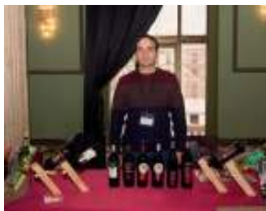
BODEGAS SAN ANTONIO ABAD