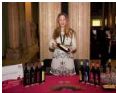
BODEGAS ROMERO DE ÁVILA