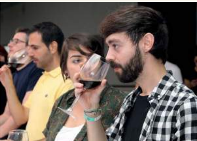
Para numerosos jóvenes, Enofestival supone su primer acercamiento al mundo del vino

“Vamos a disfrutar de este ambiente, tan bueno que se ha creado, con una copita de vino”. Así, resumía Carmen Boza su paso por el Enofestival. Una quinta edición que volvió a maridar grupos emergentes en el panorama indie con la cultura del vino. Actuaciones de la joven rockera encontraron complemento con la voz de toque flamenco y embrujo gitano con Soleá Morente, hija del mismo Enrique Morente, que puso la guinda al enofestival.