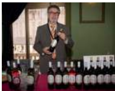
VINÍCOLA DE CASTILLA