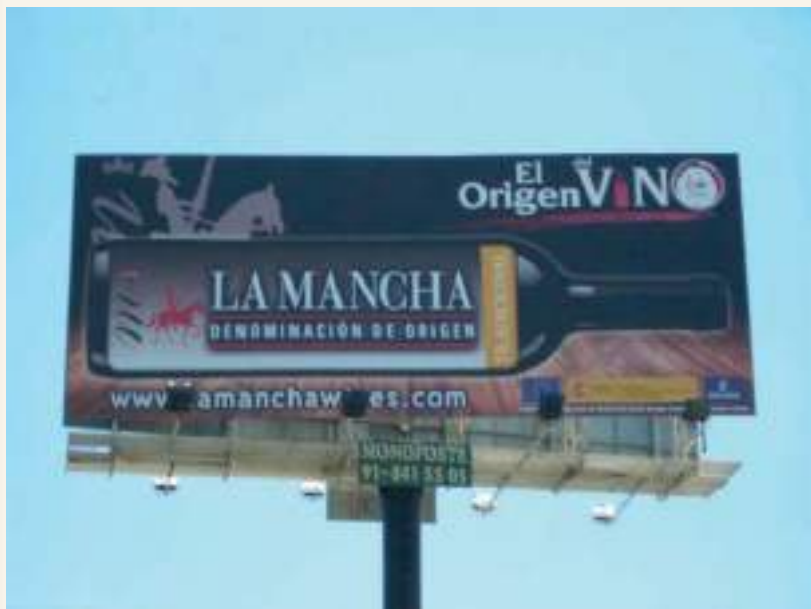
Cartel de los vinos DO La Mancha en un autovía

Según datos de la propia Dirección de General de Tráfico, se han previsto alrededor de 13,6 millones de desplazamientos en el operativo especial desplegado entre el 23 de diciembre, a las 15,00 horas hasta medianoche del día 6 de enero. Una cifra, aparentemente menor si la comparamos con los 84 millones de desplazamientos por las carreteras durante todo el pasado mes de agosto, pero más concentrado en un menor número de días.