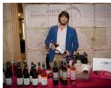
DOMINIO DE PUNCTUM, VINOS ECO- LÓGICOS Y BIODINÁMICOS