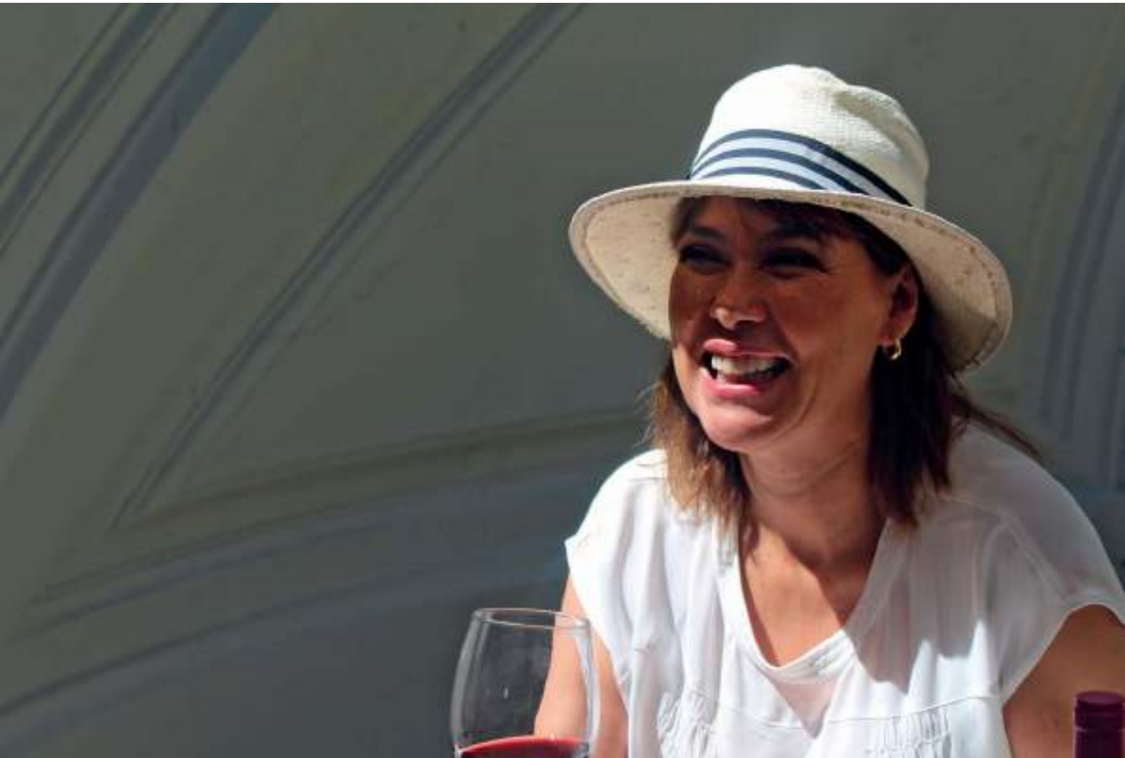
Mabel Lozano, rostro conocido en las pantallas

Modelo, actriz, presentadora de televisión... Uno tiene la sensación de conocer de toda la vida a Mabel Lozano cuando charla con esta ‘ciudadana del mundo’. Toledana de corazón, decimos ‘ciudadana del mundo’ porque su reciente documental Chicas Nuevas 24 Horas le está llevando a recorrer, prácticamente, todo los rincones del planeta, denunciando una práctica tan universal como tristemente antigua en la historia del ser humano.