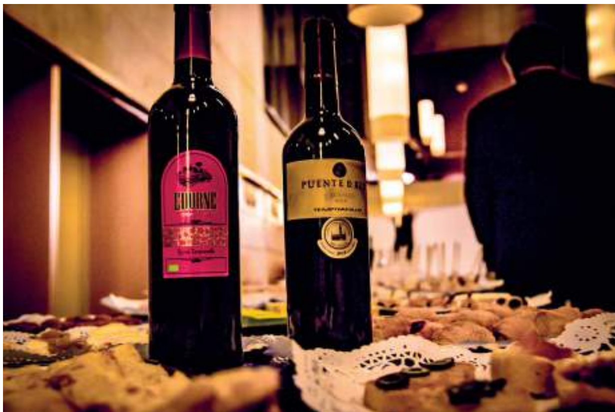
Algunos vinos DO La Mancha que se degustaron en el Fescigu