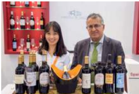
Vinícola de Castilla