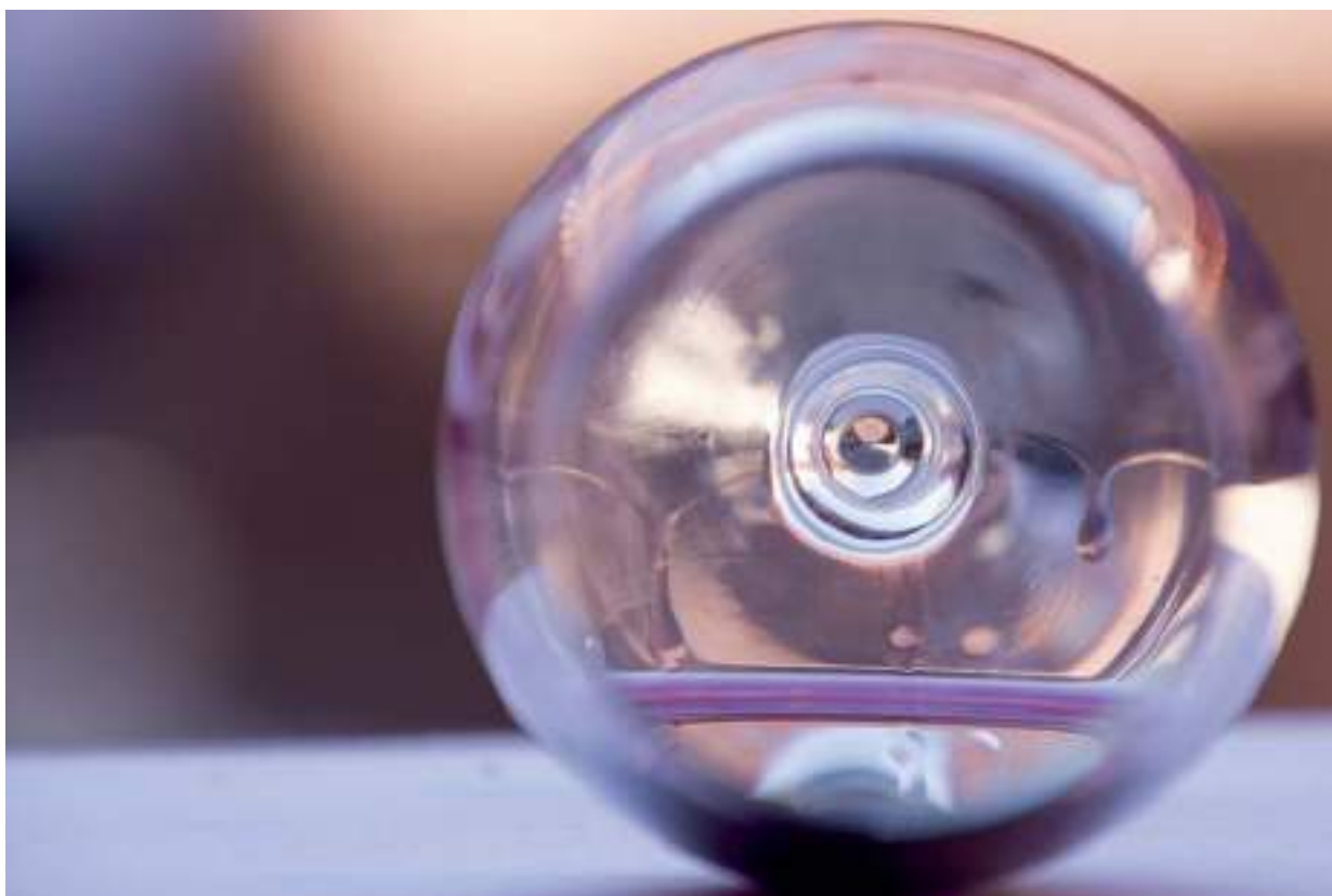
La producción mundial del vino se mueve en contextos globales desde hace décadas