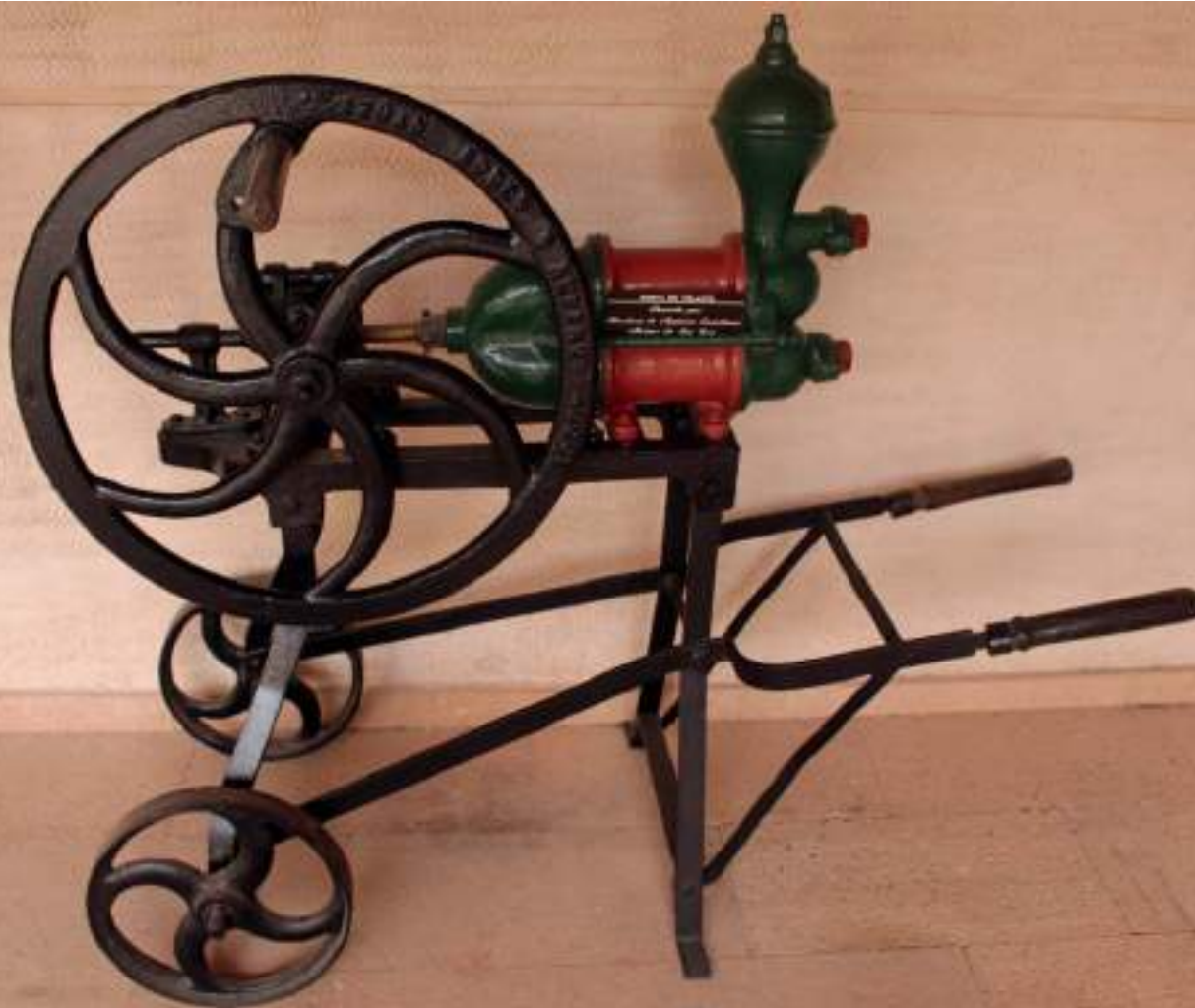
Antiguamente, las labores de trasiego se realizaban con bombas manuales

sentidos para vigilar con celo, su proceso creador, para supervisar de cerca el milagro de vida, bacteria y fermentación. “Es muy complicado, elaborar buen vino con malas uvas. Pero es más fácil echarlo a perder con un vino mediocre teniendo buenas uvas si no estás atento”, reconocen muchos técnicos en las bodegas. Por eso el proceso resulta vital en un margen de días que puede determinar el vino de una añada para una bodega.