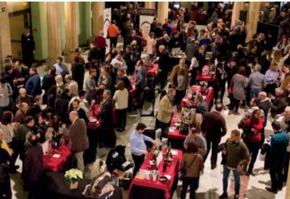
El público madrileño respondió en el segundo día dedicado a los aficionados

de la primera vez que fueran presentados los vinos manchegos en la capital madrileña.