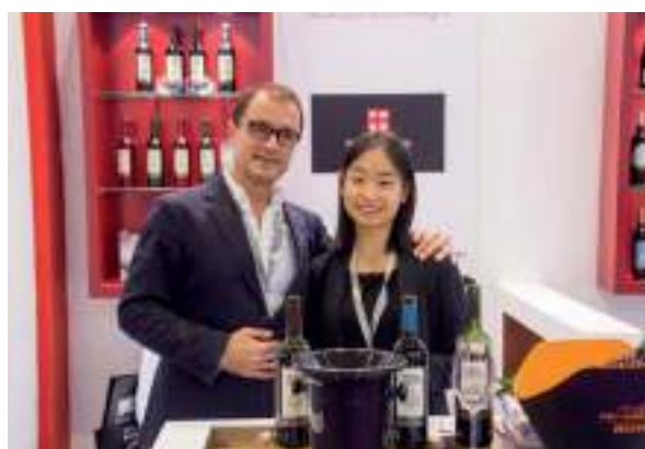
Bodegas Isidro Milagro