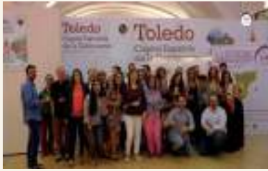
Periodistas de la ciudad de Toledo conocen los vinos DOLaMancha