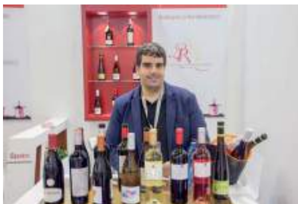
Bodegas La Remediadora