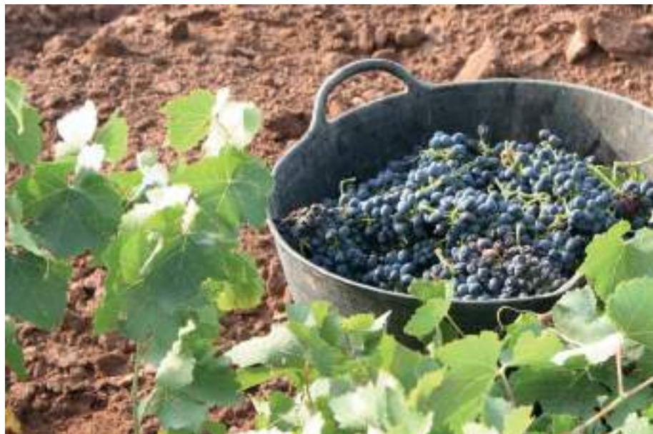
Capacho con uva tinta tempranillo