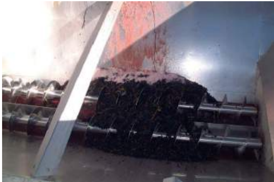
La calidad ha sido la tónica dominante en la uva entrante en las tolvas