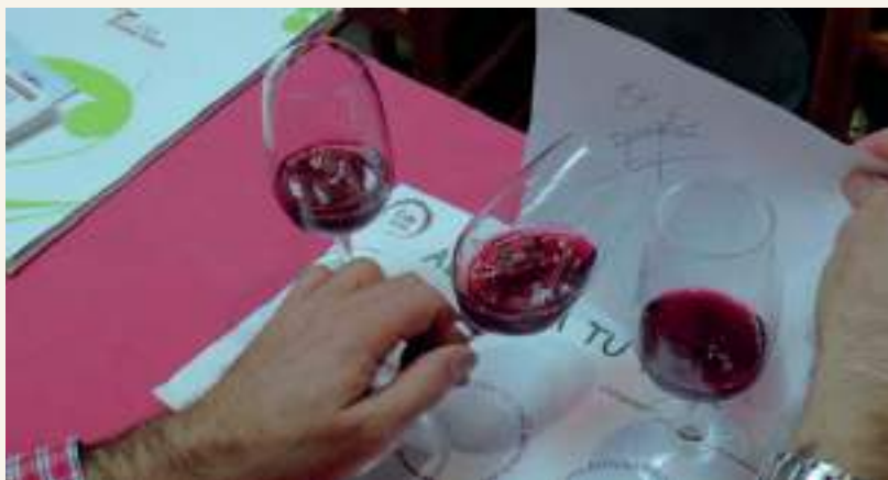
Los asistentes pudieron catar algunos tintos de la nueva Añada

la cita no pasó desapercibida, y del 10 al 13 de noviembre se sumó a los actos con interesantes iniciativas. Una de ellas, fue 'Adivina tu vino', celebrado el sábado 12 en la Posada de los Portales tomellosera. De una manera distendida los participantes tuvieron que "adivinar" los diferentes tipos de vinos que fueron catando de manera ciega: variedades en blancos y tintos, además de añadas.