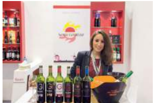
Coop. Santa Catalina