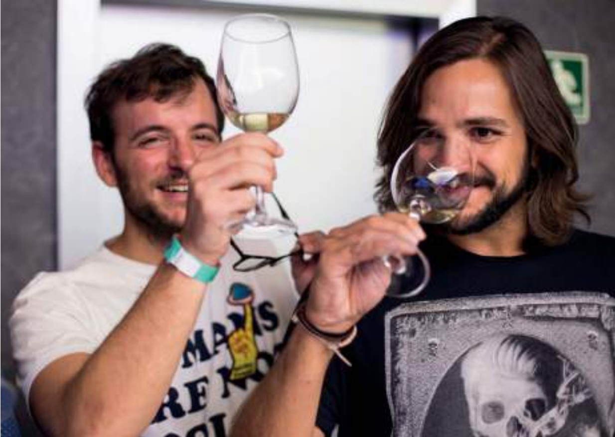
Música indie, nuevas tendencias y vino concitaron al público joven en la última edición de Enofestival 2016