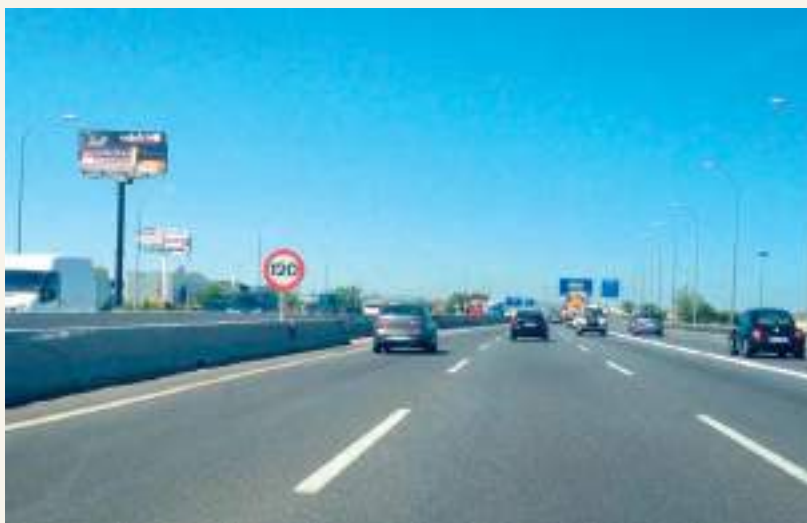
La Mancha sale al paso de los viajeros en las carreteras

Cuando se trata de viajes largos, nos sumamos a los consejos ya habituales: descanso, paciencia, tranquilidad y responsabilidad al volante. Lo importante es llegar siempre a tu destino, donde disfrutar, una vez llegados, nunca antes, de la copa de vino favorito y el re(encuentro) con los seres queridos.