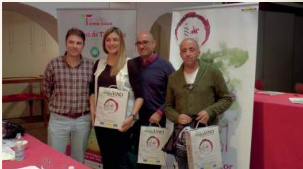
Ganadores de 'Adivina tu vino' en Tomelloso

Es el caso de Tomelloso, manantial del vino, donde el cultivo de la vid supone uno de los pilares básicos que sostiene la economía en la comarca manchega. Para Tomelloso,