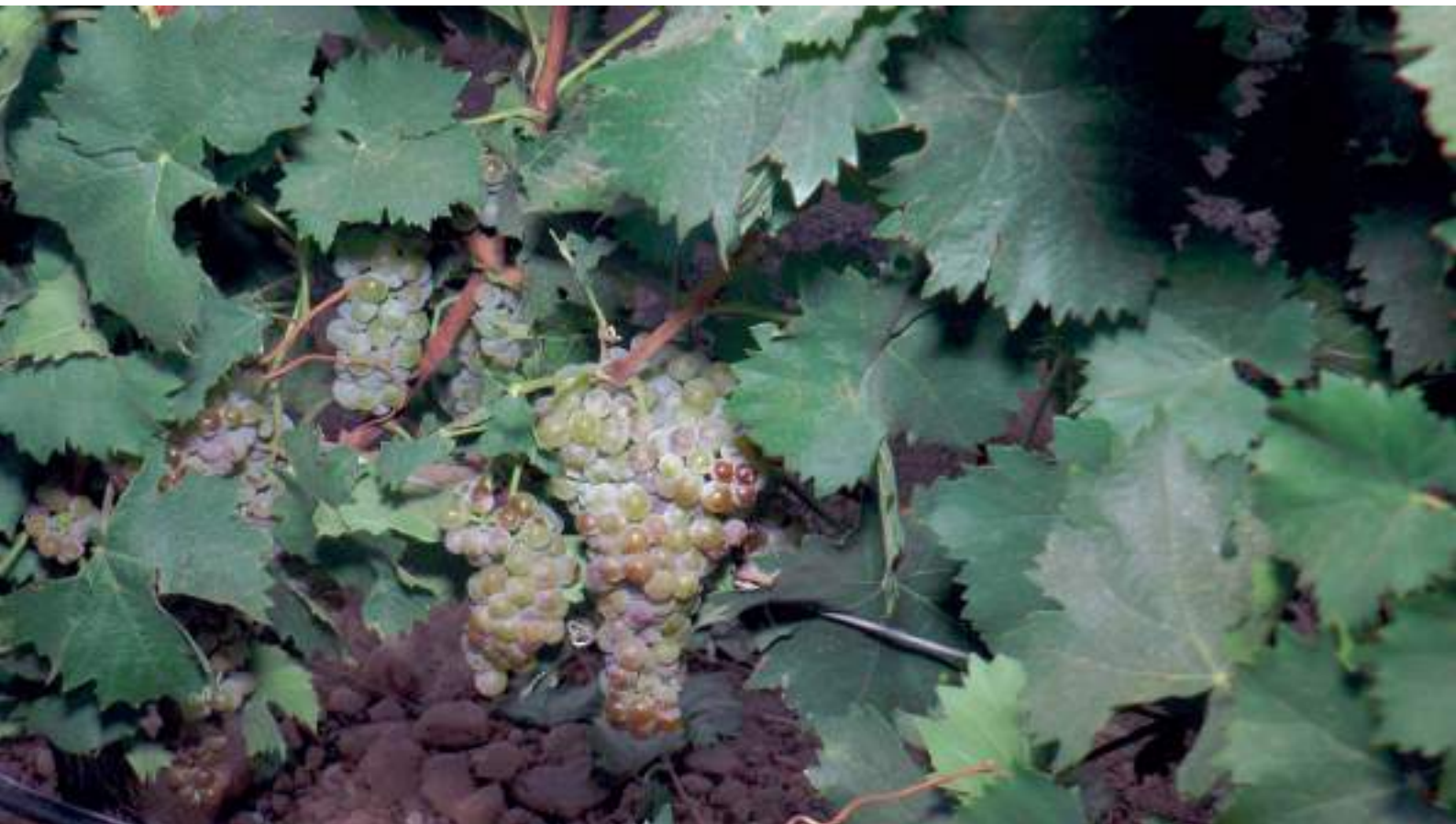
En blancos, los niveles de acidez han sido correctos

más que aceptables, y unos blancos también en muy buen estado, desde el autóctono airén a los varietales”, que ya estaban listos para ser embotellados a mediados del mes de noviembre en el caso de la bodega que también preside, la Cooperativa Santa Catalina de La Solana, en Ciudad Real.