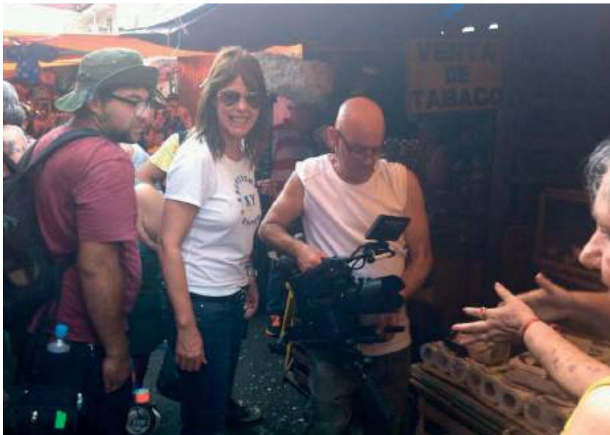
Equipo de rodaje en Paraguay

Tengo que decirte, y además es cierto que no hablamos de esto porque esté con una copa en mano, sino porque yo soy de vino. Yo solo tomo vino, y me gusta siempre. Solemos quedar para tomarnos una copa más que una cerveza, siempre