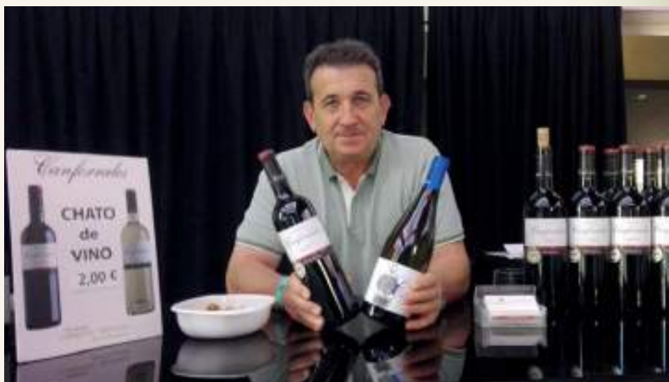
Bodegas Campos Reales también contó con stand propio en el Enofestival

sobre el mediodía y hasta pasadas las doce de la noche, Enofestival, reflejó un interés del público asistente por catar y degustar los vinos DO La Mancha. Incluso, algunas de las botellas se agotaron pasa-