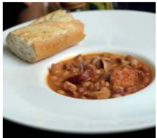
Alubias pintas con arroz

¡Con cualquier vino que le apetezca al comensal! En el caso de ensaladas, purés y sopas frías, las mezclas de ingredientes suelen ser más frescas y un vino blanco, aromático y seco puede ser un buen aliado. Lo mismo para las elaboraciones fritas, un vino blanco y fresco puede armonizar muy bien. En cambio, aquellos guisos de legumbres con ingredientes más potentes, con más fuerza de sabor, armonizarán mejor con un tinto con más cuerpo.