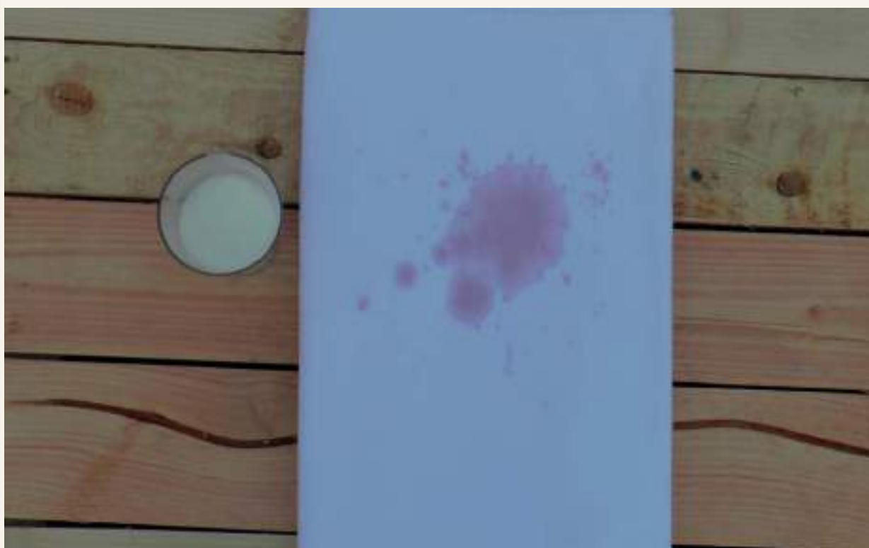
Truco para limpiar una mancha de vino con leche

El Consejo Regulador lanza un concurso popular sobre trucos con manchas de vino que regalará el peso en vino al más votado