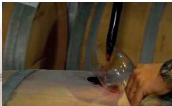
Un enólogo recoge una muestra desde una barrica

En cuanto a su forma, la tradición las ha hecho cilíndricas para facilitar su transporte en los barcos, haciéndolas rodar por los estibadores de puerto. Por el contrario, ofrecen menos facilidades de almacenaje en las cuevas. Una opción, recientemente descubierta son las barricas cuadradas, que permiten un apilamiento más sencillo en espacio.