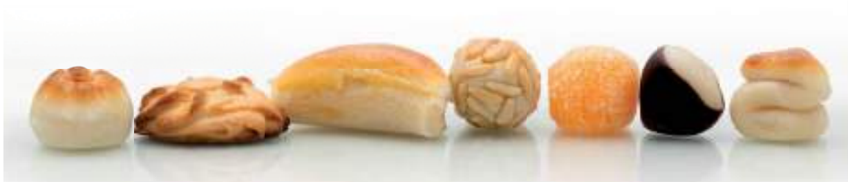
Mazapán toledano, manjar internacionalmente apreciado