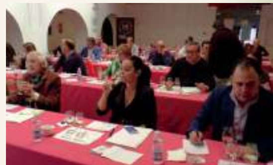
Participantes en 'Adivina tu vino' en Tomelloso