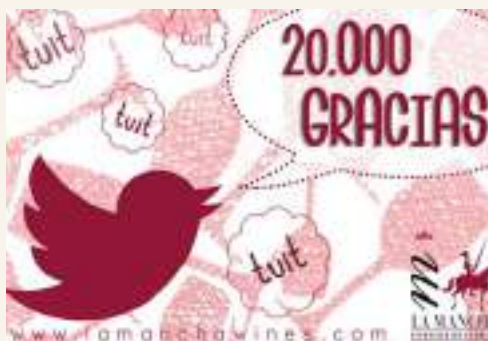
20.000 seguidores se alcanzaron este verano en twitter

La Mancha consolida su liderazgo en Facebook en la promoción de los vinos con Denominación de Origen