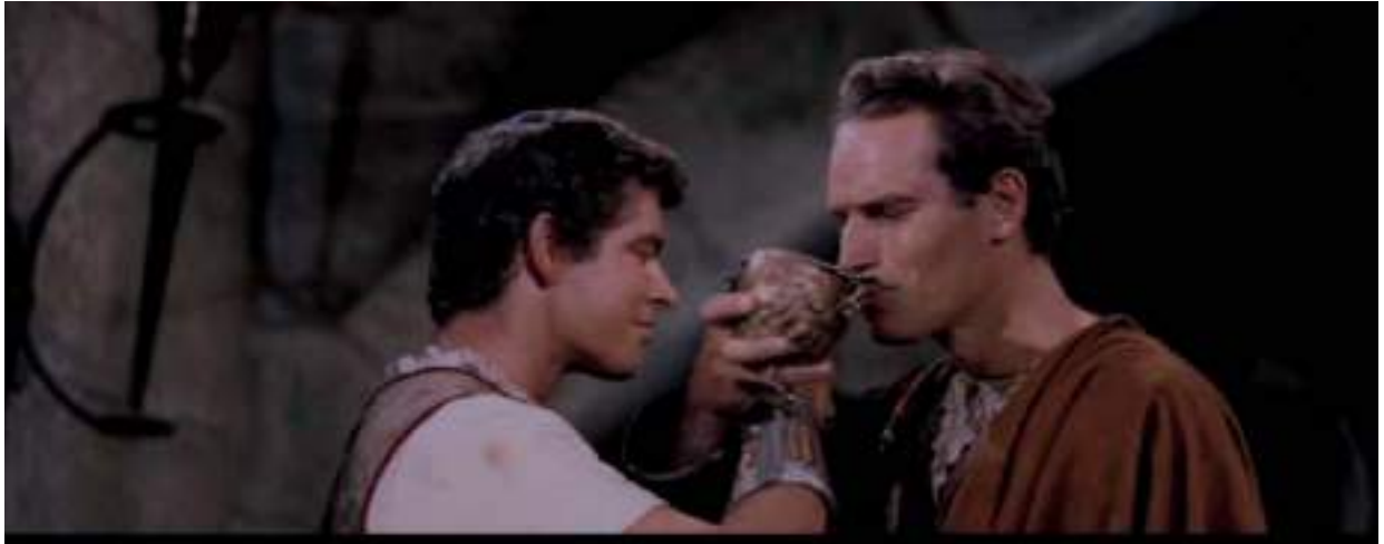
Fotograma de la película 'Ben Hur', escena del brindis de la amistad

al ingenio, la lógica y el buen humor inteligente. Hemos elegido un blanco de cuerpo, un chardonnay fermentado en barrica en el guiño a una película que ha envejecido bien, sin perder su refrescante frescura. Si es la primera vez que se contempla esta película, su novedad y frescura valen la pena acompañarlas con un joven airén, de toques afrutados y ligero paso por boca.