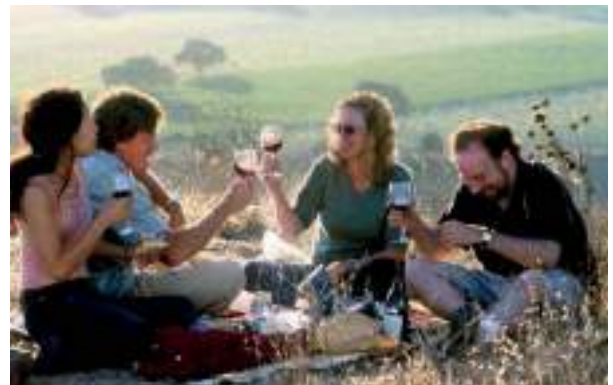
Fotograma extraído de la película 'Entre copas'

“Un buen vino es como una buena película: dura un instante y te deja en la boca un sabor a gloria; es nuevo en cada sorbo y, como ocurre con las películas, nace y renace en cada saboreador.”