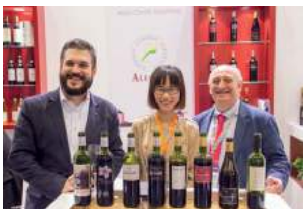
Bodegas Centro Españolas