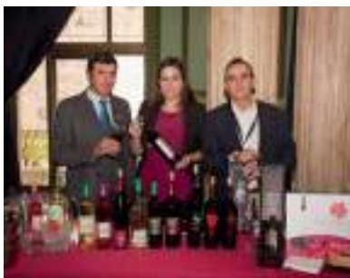
VINOS COLOMÁN S.A.T.