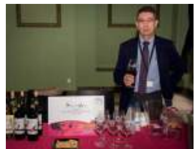
FINCA LA BLANCA - VINOS LA FONTANILLA