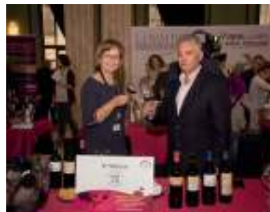
BODEGAS EL VÍNCULO