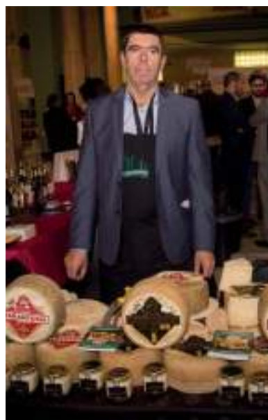
Quesos La Casota