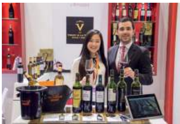
Bodega Almazara Virgen de las Viñas