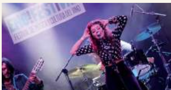
Solea Morente, vertiendo su alma flamenca sobre los escenarios

da la media tarde, lo que demostró la buena respuesta de los jóvenes hacia el vino. Un colectivo por el que la apuesta promocional de los vinos manchegos ha incidido más durante los últimos años.