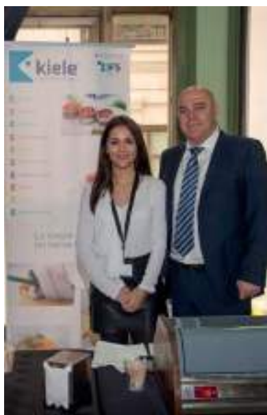
Conservas artesanales, Kiele