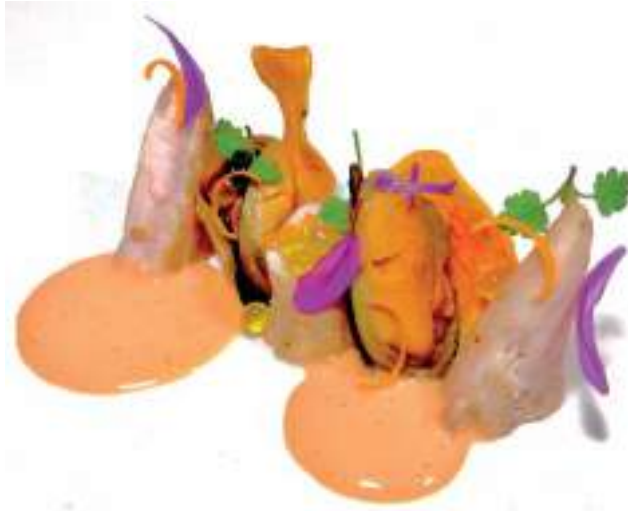
Mejillones con perdiz

En esta ocasión el chef nos recomienda empezar el menú con un espumoso. La tradición los sitúa como vinos de brindis. Craso error, ya que pueden acompañarnos durante toda la comida.