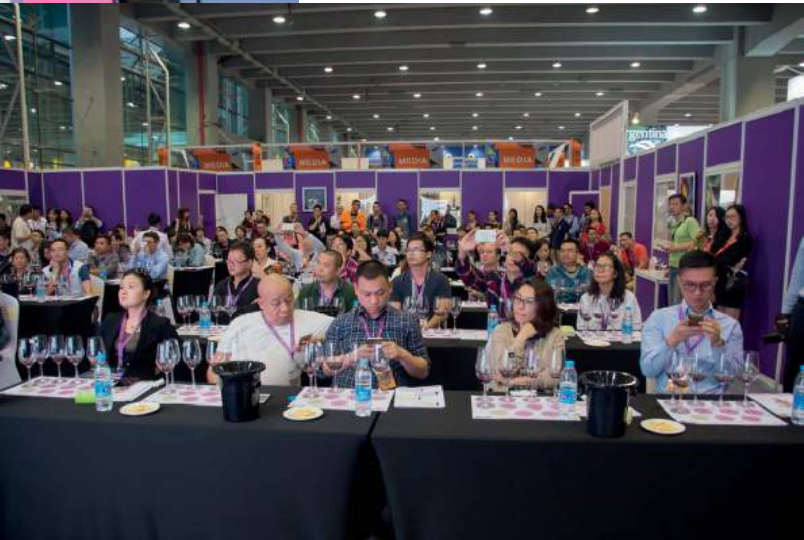
Seminario de cata con público chino

en estas ferias es más bien tímido”. Desde que iniciaran las relaciones comerciales con el país chino, a principios del siglo XXI, el crecimiento ha sido continuo para los vinos de DO La Mancha, pasando de las 1.500 botellas testimoniales, en 2003 a los 4.302.204 de botellas importadas, en lo que va de año en este 2016, que puede convertir a China en el principal cliente mundial para los vinos con Denominación de Origen La Mancha.