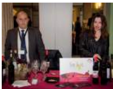
BODEGAS SAN JOSÉ