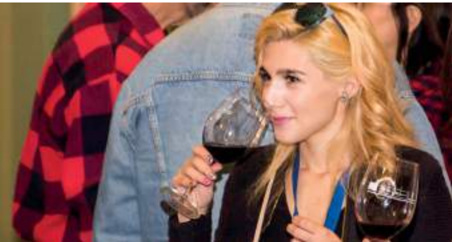
Numeroso público joven se interesó por catar los nuevos vinos