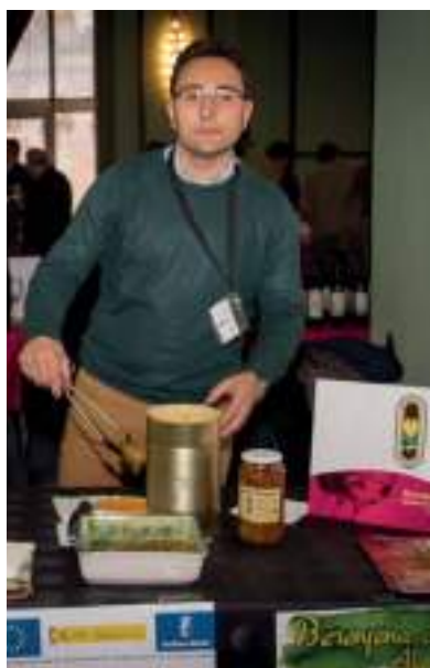
Berenjenas de Almagro