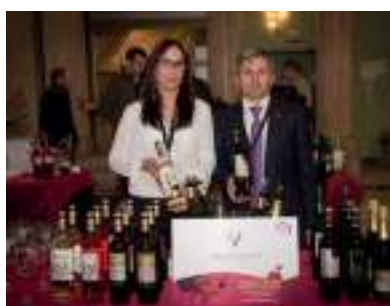
VIRGEN DE LAS VIÑAS, BODEGA Y ALMAZARA