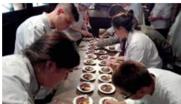
Alumnos de Escuela de Hostelería de la IES Universidad Laboral de Toledo

La otra cita con el cine, como viene siendo habitual estuvo en el Festival de Cine de Guadalajara donde el vino manchego volvió a arropar la última edición de Fescigu , celebrada en septiembre.