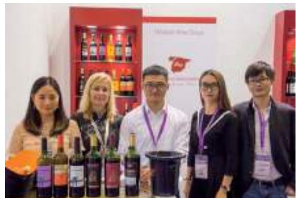
Viñalesa Wine Group