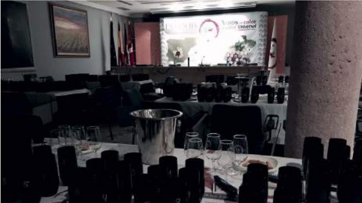
La 'Cata de Preferencia' se desarrolló con bajas condiciones de luz, a propósito

El Turismo, unido al conocimiento de la Cultura del Vino, algo conocido como enoturismo, gana adeptos cada año en España. Inherente a la propia gastronomía, y por tanto, elemento común de la tradición e idiosincrasia que conforma el tronco común de la historia de los pueblos de cultura mediterránea, el vino es hoy un recurso económico, reclamo y cita para los visitantes contemporáneos. El turista del siglo XXI busca experiencias y en eso, el vino, como enoturismo cada año cautiva los paladares más inquietos.