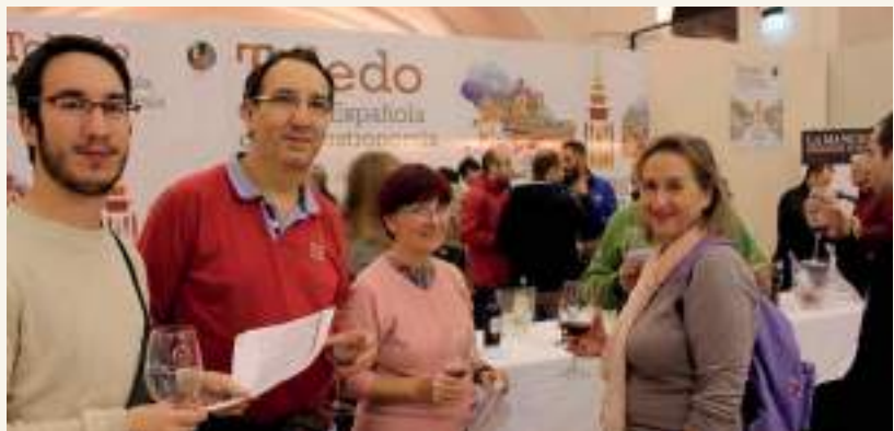
Numerosos turistas han pasado por San Marcos para conocer los vinos DO La Mancha

Por otro lado, si estuviera con amigos o familiares, tomaría un blanco en un restaurante que tuviese un sótano, cueva o aljibe habilitado, y que pudiera ser el espacio adecuado para tener una buena conversación entre trago y trago.