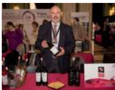
VIÑEDOS Y BODEGAS MUÑOZ