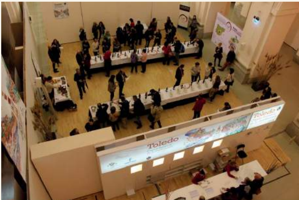
Degusta Toledo en San Marcos ha sido una de las acciones más exitosas en la Capitalidad Gastronómica

Toledo cierra con balance positivo el año de la Capitalidad Gastronómica