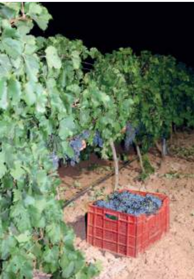
Vendimia nocturna manual