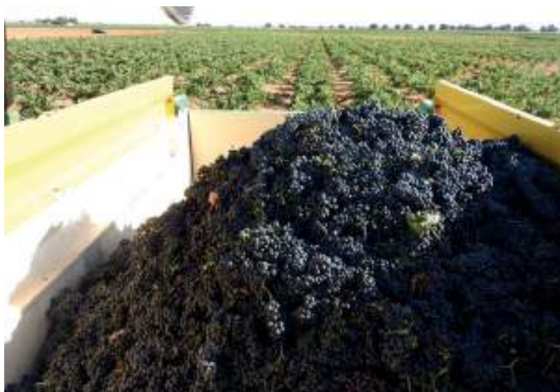
Tempranillo recogido en Campo de Criptana

Un primer análisis arroja información sobre el panorama actual de la producción internacional del vino que sigue situando a tres países de Europa en los primeros puestos del ranking. Una lista que lidera Italia