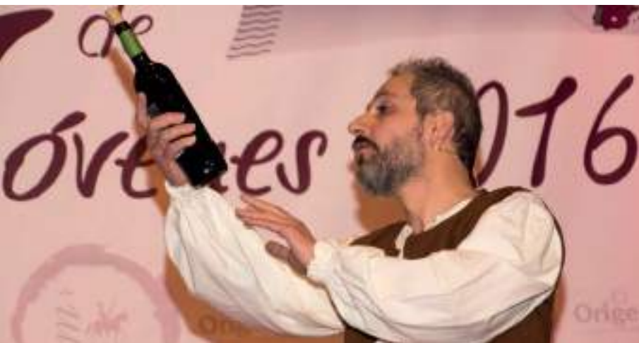
No faltaron algunos fragmentos del Quijote para amenizar el acto