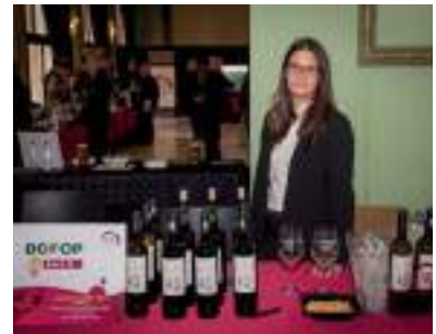
DCOOP SECCIÓN VINO ( BACO )