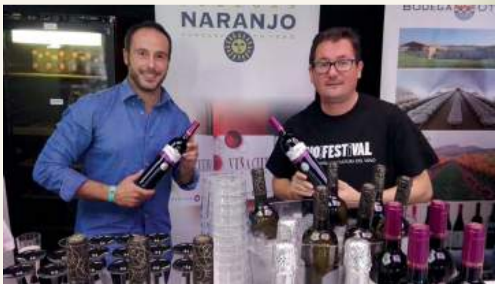
Bodegas Naranjo en Enofestival

También estuvieron a título individual bodegas como Campos Reales y Bodegas Naranjo, cuya marcas más conocidas Canforrales y Viña Cuerva , respectivamente, también interesaron al consumidor presente. Un consumidor joven del siglo XXI, el llamado público millennial que demuestra su intención por el consumo de nuevas y diferentes propuestas vinícolas, desde vinos con toques más clásicos pasados por madera, hasta tintos jóvenes y blancos, con mayor aporte de frescura y equilibrada acidez en boca. Desde que se abrieron las puertas