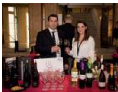
BODEGAS EL PROGRESO