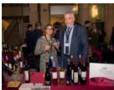
VINÍCOLA DE TOMELLOSO