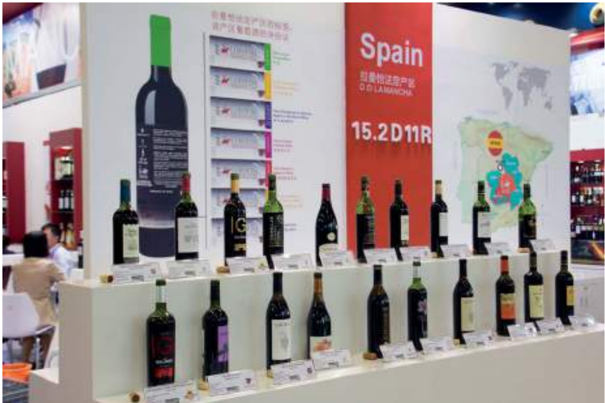
Vinos de las 11 bodegas participantes a disposición en libre degustación

En el caso de los vinos manchegos, acompañaron al Consejo Regulador unas once bodegas como: