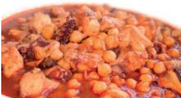
Callos de pulpo con garbanzos