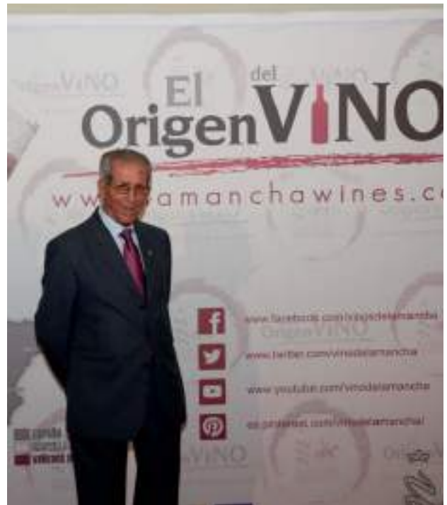
Bahamontes, premio honorífico 'Gran Reserva' "Yo recomiendo a los jóvenes beber más vino y menos copas. Estarán más sanos, como yo. Basta con mirarme"